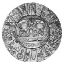
Так называемая пластина (солнце) Эченике (Sol de Echenique). Перу. Ок. V века

7. На территории нынешнего Перу процветала еще одна цивилизация — империя Верховного Инки, или Сына Солнца. Это была диктаторская, коммунистическая монархия. Из дворца, построенного на высоте в тринадцать тысяч футов неподалеку от озера Титикака, Сын Солнца правил миллионами подданных. Власть его обеспечивали дороги военного назначения, гарнизоны, наместники. Земли и стада принадлежали государству. Ремесленник мог владеть только инструментом. Крестьянин оставлял себе треть урожая, вторую треть он отдавал государству, а третью — Инке. Сельскохозяйственная продукция и продукты ремесленного производства перераспределялись чиновниками. Система была суровая, но соблюдалась четко, потому что Инка — просвещенный деспот — заботился о своем народе. Перуанцы, как и мексиканцы, знали календарь. И сегодня еще туристы могут видеть астрономическую обсерваторию — башню, с которой жрецы наблюдали за движением светил. Храмы представляли собой