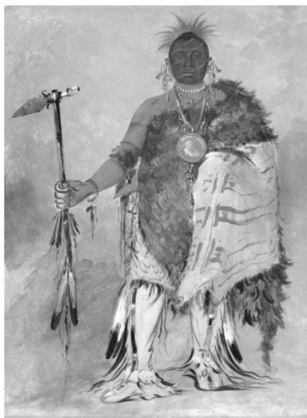
Джордж Кэтлин. Большой Лось. Знаменитый воин племени омаха. 1832

помощи красителей, добывавшихся их корней красного дерева и других древесных пород, корзинчики окрашивали полоски ивовой или шелковичной коры в черный, красный или желтый цвет и плели из них миски, сандалии, сумки, блюда, украшенные геометрическим орнаментом исключительной красоты. Почти все индейцы знали табак; одни курили его, другие жевали или нюхали. В некоторых племенах для курения использовались каменные или глиняные трубки, в других измельченный табак набивали в каменные цилиндрики — прообраз сегодняшних сигарет.