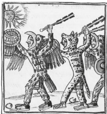
Воины ацтеков (орлы и ягуары). Миниатюра «Флорентийского кодекса» Бернардино Саагуна. XVI век

прибыл ко двору Монтесумы, императора ацтеков, индейцы с восторгом поведали ему, что их повелитель приносит в жертву богам по меньшей мере двадцать тысяч человек в год. Майя изобрели алфавит, они умели считать, сформировали идею нуля, вели точное летоисчисление и для каждого двадцатилетия (катуна) устанавливали памятные стелы. У них была величественная архитектура, они воздвигали огромные пирамиды, на усеченных вершинах которых возвышались храмы, к ним вели гигантские лестницы. Своей суровостью и мощью скульптуры майя напоминают одновременно египетскую архаику и современное искусство.