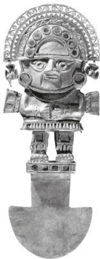
Инки. Ритуальный золотой нож с изображением бога Туми. Перу. Культура чиму