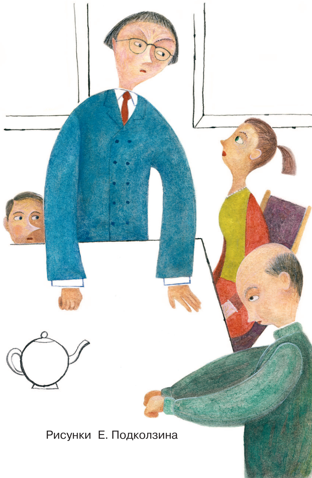
Рисунки Е. Подколзина