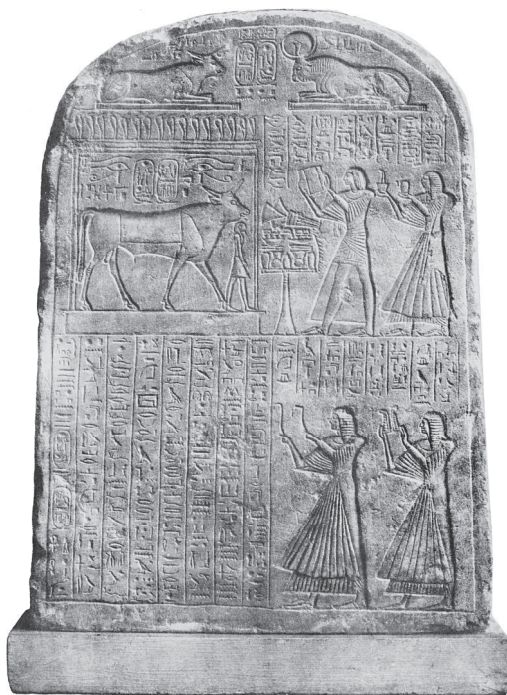
Стела с иероглифами, найденная в Серапеуме в Мемфисе. Фотография Шарля Марвиля, 1852–1857 гг.

От этих двух способов письма, вероятно, очень рано перешли к третьему, звуковому способу — к обозначению определенных звуков известными знаками или изображениями известных предметов. А это было уже громадным успехом: такие письма давали возможность в точной форме пересылать на дальние расстояния волю повелителя и, закрепляя слова и понятия, передавать потомству воспоминания о минувшем. Это искусство должно было необычайно возвысить могущество и сознание собственного достоинства правящих. Из времен 12-й династии дошла запись, в которой перечисляются различные роды занятий ремеслами: кузнец, каменотес, цирюльник, матрос, каменщик, ткач, башмачник упоминаются с некоторым презрительным юмором. В противоположность им восхваляется свободное призвание писца или ученого, которое представляется более важным, чем все ремесла. Это искусство возвысило даже национальное сознание всего народа, доставив ему возможность иметь свою историю. Громадная масса сохранившихся памятников, покрытых этими столь мудреными иероглифическими письменами, доказывает, какое высокое значение египтяне придавали истории. С другой стороны, ясно, что эти письма, хотя и были