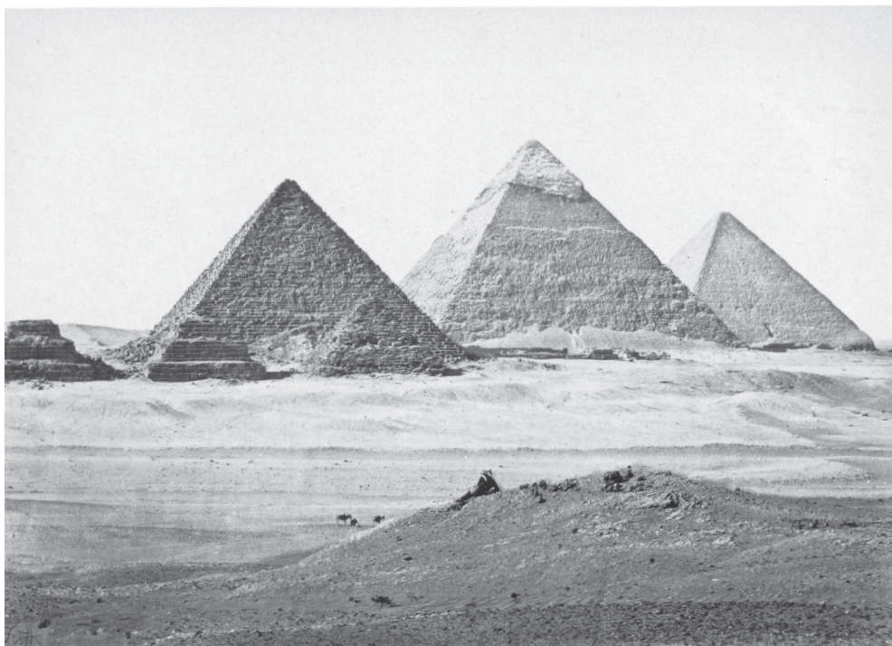
Пирамиды Гизы. Фотография Фрэнсиса Фрита, 1857 г.