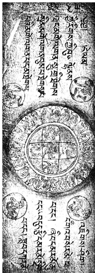
Слева: Бардо Тхёдол. Лист рукописи № 35а