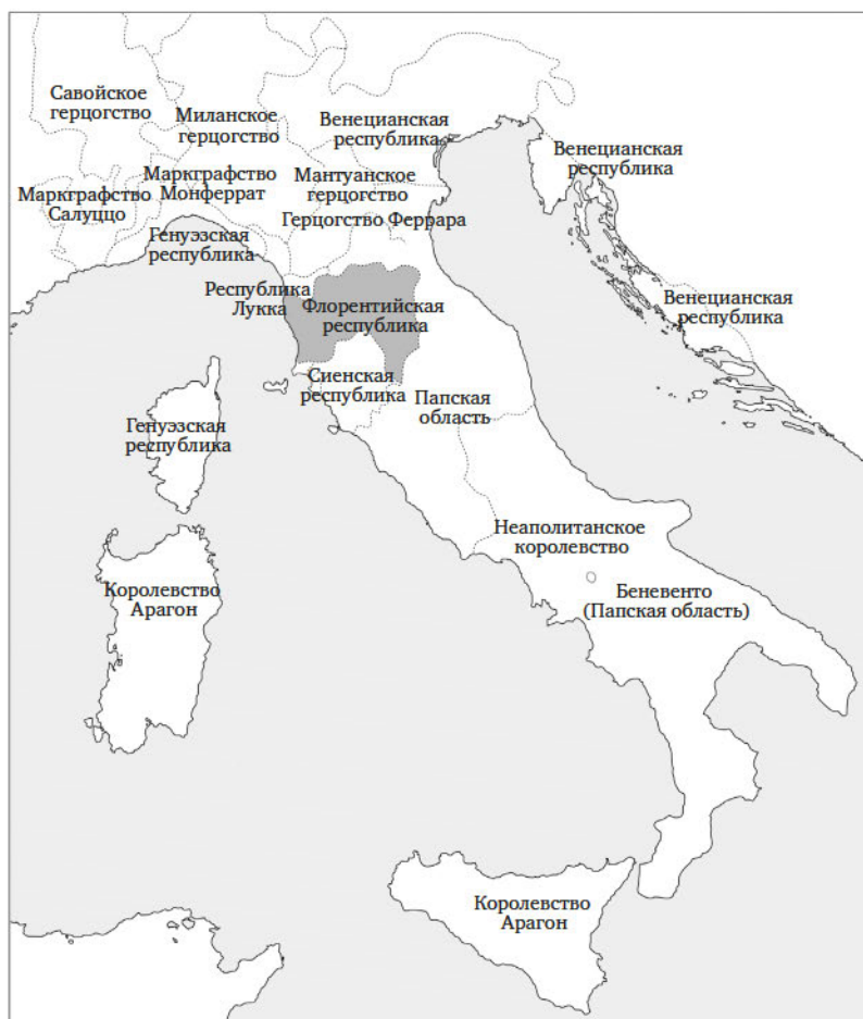
Рис. 1.1. Италия в 1494 году

Арагонской короны, после чего в нем произошли два восстания крупной знати (1459–1464; 1485–1486), которые еще сильнее его ослабили. В эту систему по мере сил встраивались второстепенные государства, например мелкие княжества Центральной Италии, правители которых становились во главе наемных отрядов и прекрасно зарабатывали в этой роли, оказывая услуги пяти главным политическим игрокам.