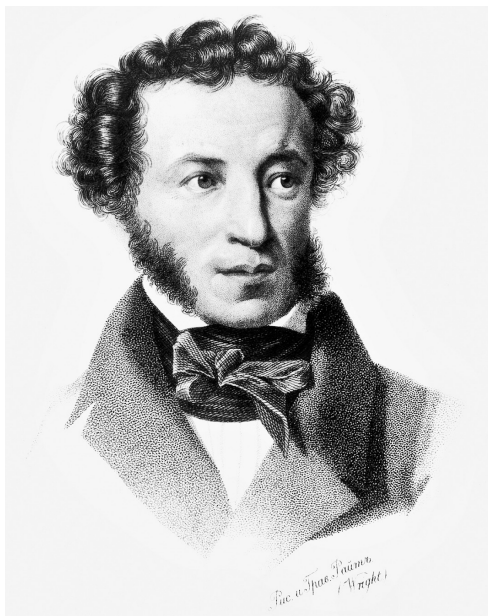
Александр Пушкин. Около 1830 года

будут занимать читателей и писателей нескольких последующих поколений. Это «лишний человек», (анти)герой своего времени, скрывающий свое истинное лицо за маской холодного эгоиста (Онегин); наивная провинциальная девушка, честная и открытая, готовая на самопожертвование (Татьяна в начале романа); поэт-мечтатель, гибнущий при первом столкновении с реальностью (Ленский); русская женщина, воплощение изящества, ума и аристократического достоинства (Татьяна в конце романа). Это, наконец, целая галерея характерологических портретов, представляющих русское дворянское общество во всем его разнообразии (циник Зарецкий, «старик» Ларины, провинциальные помещики, московские бары, столичные франты и многие, многие другие).