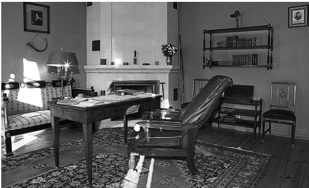
Кабинет Пушкина в музее-усадьбе «Михайловское»

но и метароман (роман о том, как пишется роман).